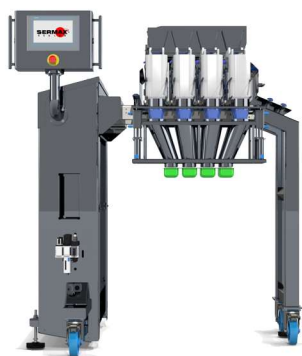
Vista frontal ( versión de 4 líneas )

(*) Dependiendo del número de líneas y tipo de producto.