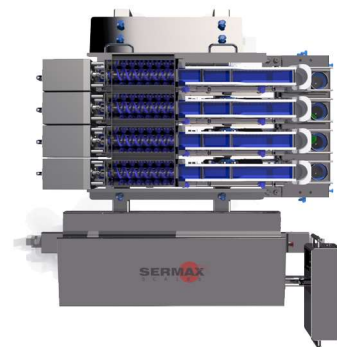
Vista en planta

La gama de pesadoras SERMAX® LMB "M" ha sido diseñada para efectuar dosificaciones hasta 0.70L, mejorando la higiene y seguridad dentro del entorno de pesaje y enfocada en productos adherentes y frágiles, manteniendo al mismo tiempo el alto nivel de precisión requerido. Las características clave incluyen: