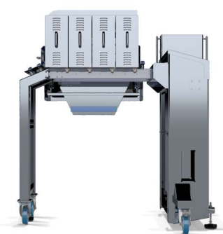
Vista posterior ( Diseño modular )