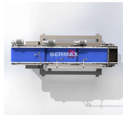
Vista en planta

La gama de pesadoras SERMAX®LWB ha sido diseñada para efectuar dosificaciones entre 5 y 20 L, con transportadores más anchos, mejorando la higiene y seguridad dentro del entorno de pesaje y enfocada en productos adherentes y frágiles, manteniendo al mismo tiempo el alto nivel de precisión requerido.