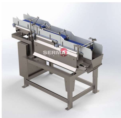
Vista de perspectiva