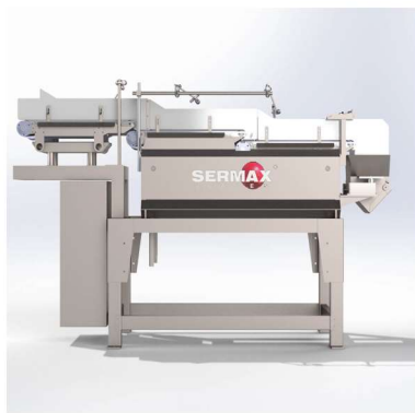
Vista de perfil